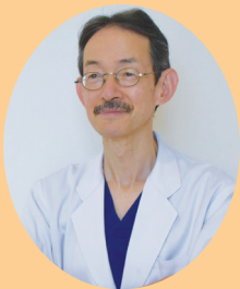
産婦人科医 直原廣明 監修